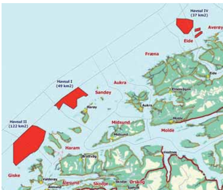
Figur 2. Lokalisering av de planlagte vindturbinparkene til havs, Havsul I, II og IV (markert i rødt) utenfor kysten av Møre og Romsdal. Til sammenligning utgjør arealet av Havsul II parken alene om lag 5 ganger arealet av verdens nåværende største vindturbinpark til havs, ved Horns Rev utenfor vestkysten av Danmark. The location of the planned offshore wind farms, Havsul I, II and IV (marked in red), off the coast of Møre og Romsdal. To get an idea of the scale, the area covered by the Havsul II farm alone is about five times bigger than what is currently the world's largest offshore wind farm: Horns Rev off the west coast of Denmark,