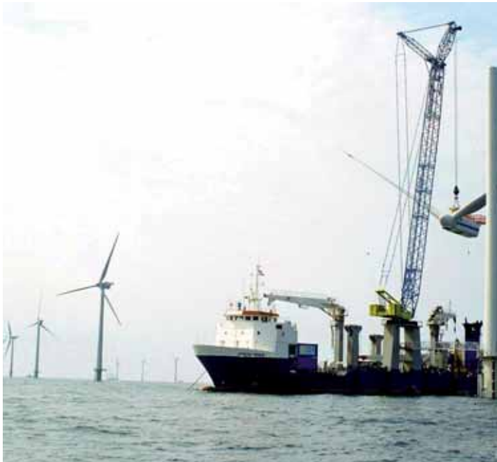
Figur 1. Fra utbyggingen av Horns Rev vindturbinpark utenfor vestkysten av Danmark i 2002. Construction of the Horns Rev wind farm off the west coast of Denmark in 2002.

This report provides a summary of what we currently know about the potential environmental impacts of offshore wind farms on biodiversity, vulnerable marine ecosystems and groups of organisms, and also sets out potential consequences for the fishing, the kelp and fish farming industries.