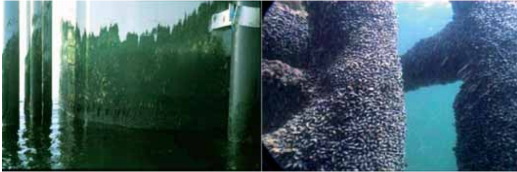
Figur 4. Påslag av grønnalger (til venstre) og blåskjell (til høyre) på vindturbinfundamenter ved Horns Rev vindpark, utenfor Danmarks vestkyst, omtrent ett år etter at turbinfundamentene ble utplassert. Green algae (left) and mussels (right) on wind turbine foundations at Horns Rev wind farm, off the west coast of Denmark, around one year after the foundations were installed.